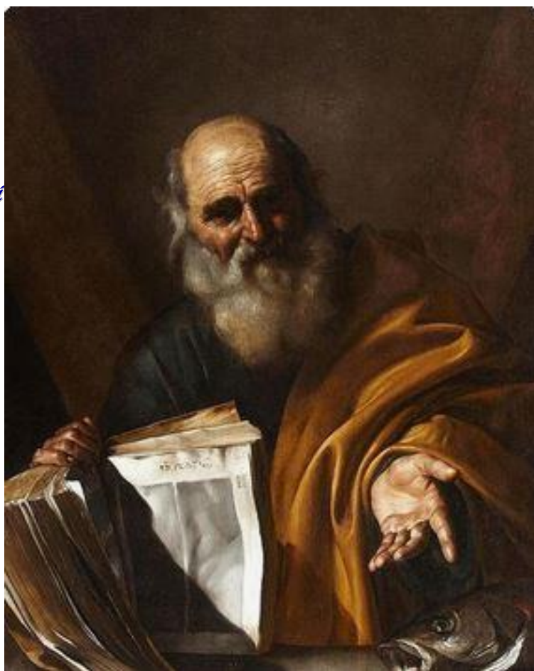
Andrea Apostolo Barocco Spagnolo

Questo è il gruppo dei finanziari ed economisti. Essi opereranno con le energie e le forze che si esprimono negli scambi e nei valori commerciali; si occuperanno della legge della domanda e dell'offerta e del grande principio della Condivisione che sempre governa il Proposito Divino.