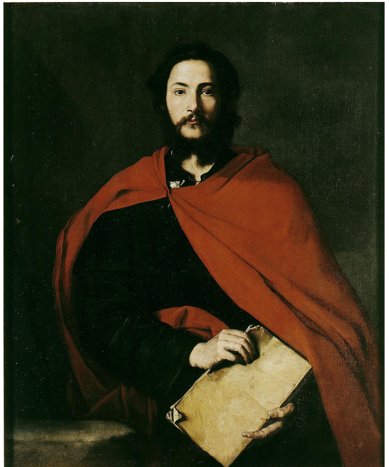
José de Ribera, San Giacomo il Maggiore, 1634

Loro compito principale sarà di collegare, con tecniche riconosciute, Anima e personalità, arrivando alla rivelazione del Divino per mezzo dell'Umanità.