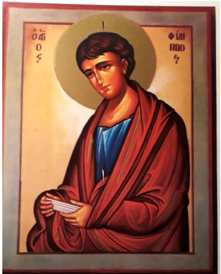
Icona San Filippo Apostolo

Questo è il gruppo dei Creatori. Essi mettono in rapporto il terzo aspetto divino, l'Aspetto Creativo, come si esprime attraverso l'opera creativa e in risposta al mondo del pensiero, e il primo aspetto, la Vita. Uniscono e fondono creativamente vita e forma.