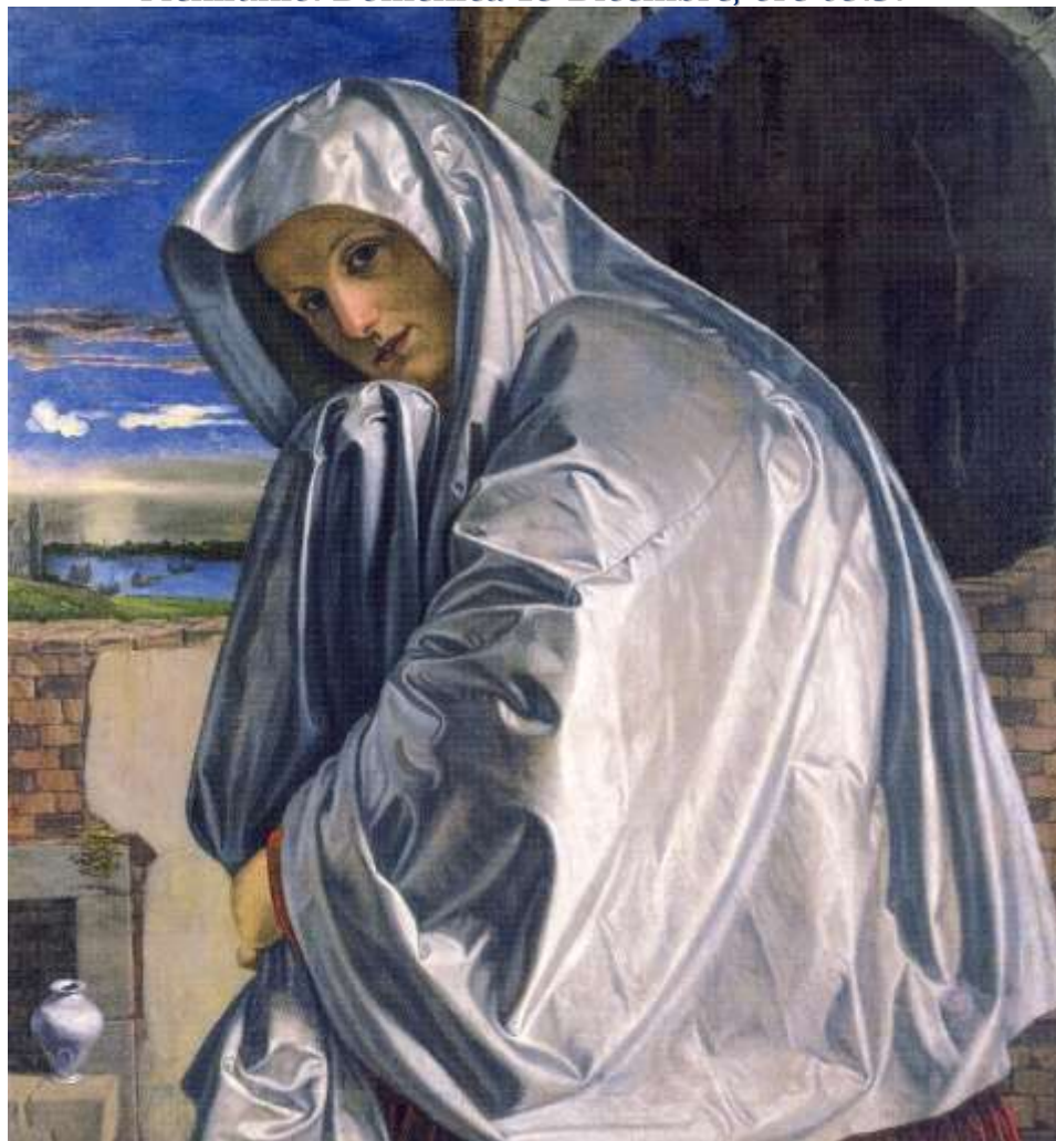
Giovan Gerolamo Savoldo: Maddalena, 1508. Londra National Gallery

Plenilunio: Domenica 19 Dicembre, ore 05.37