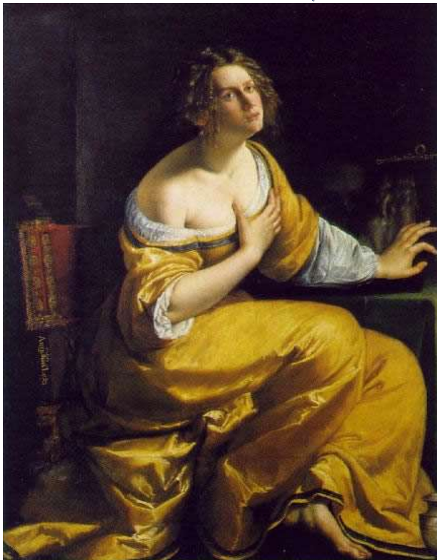
ARTEMISIA GENTILESCHI: La Maddalena rinuncia alla Vanità 1620 - Galleria Palatina Firenze

Plenilunio: Mercoledì 20 Ottobre, ore 16.58