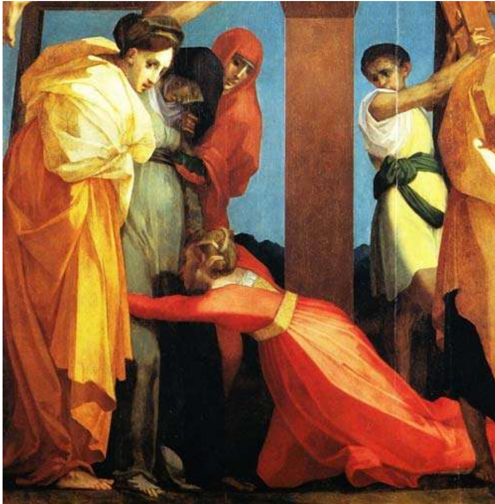
ROSSO FIORENTINO: Deposizione - 1521- Pinacoteca di Volterra

Plenilunio: Martedì 21 Settembre, ore 01.56