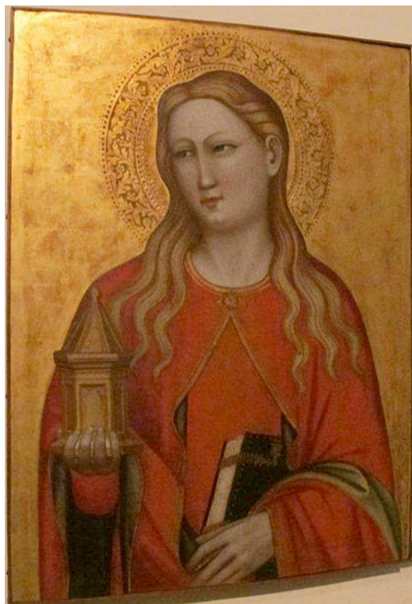
Antonio Veneziano: Maria Maddalena 1368 Pinacoteca Vaticana

II Plenilunio: Domenica 22 Agosto, ore 14.03