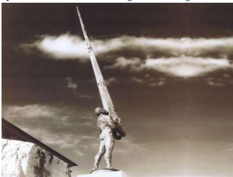
Ivan Theimer: "Ercole con obelisco", Foligno 2004

Questo vuol dire dominare magneticamente gli elementi e volare al di sopra della forma.