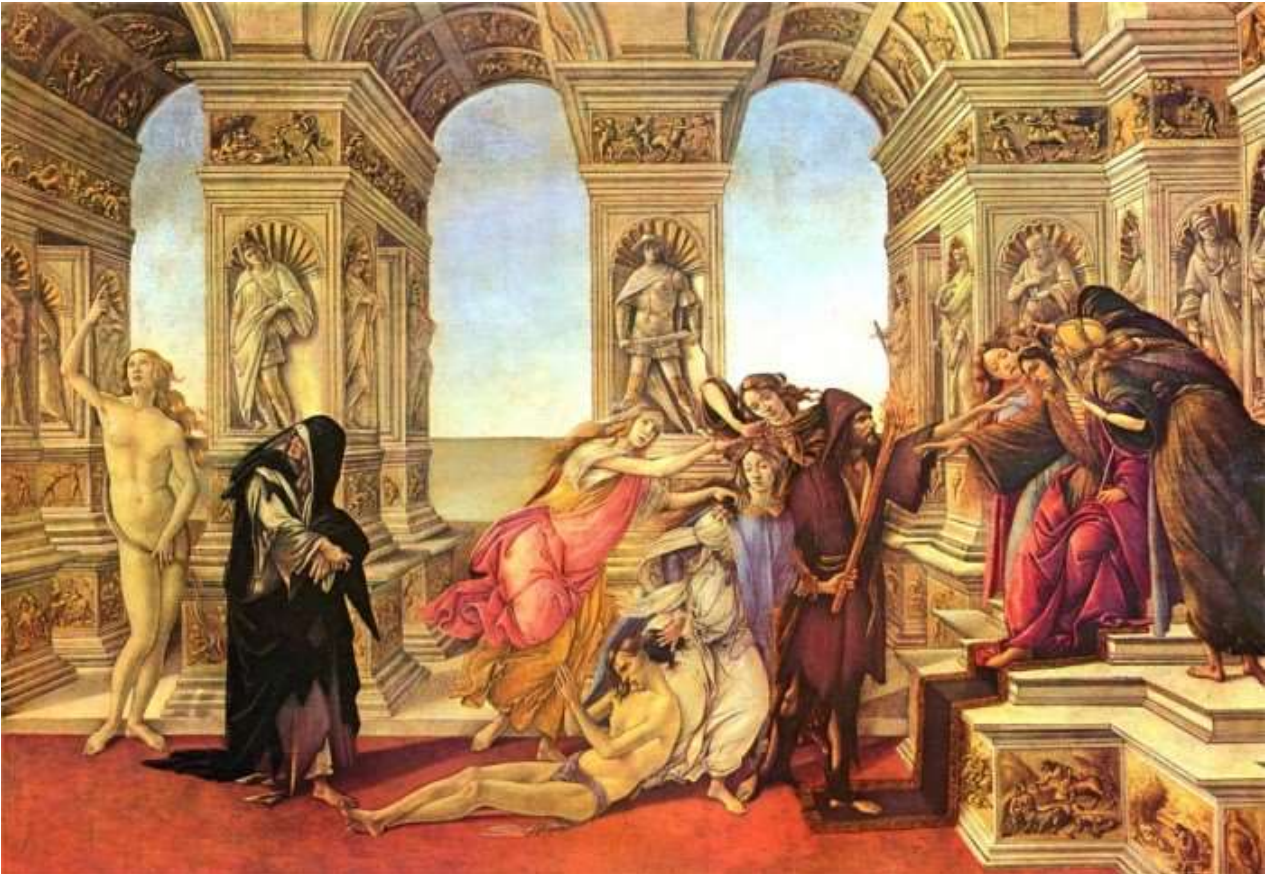
Sandro Botticelli: La Calunnia

Novilunio: Domenica 15 novembre, ore 06.08