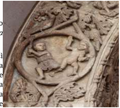
Portale del Duomo di Pavia: Gemini

Mai come ora questo termine ha assunto un significato così importante nell’attuale esperienza planetaria che l’umanità sta vivendo, al di là di ogni confine o limitazione, inimmaginabile prima del lockdown. È un invito a orientarsi nella vasta gamma delle possibili connessioni, a qualsiasi livello, sia esteriormente sia interiormente, in senso verticale e orizzontale, senza mai perdere