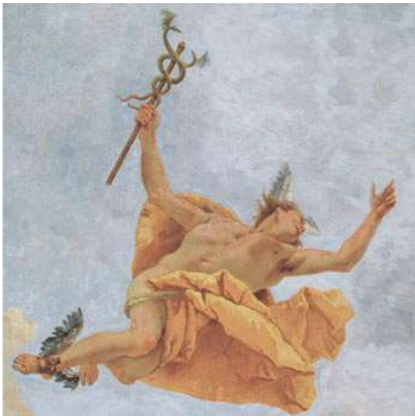
Mercurio, il Messaggero degli Dei

"Non sono venuto a portare la pace, ma una spada", 7 queste parole di Gesù ai discepoli, nel Vangelo di Matteo, le possiamo riportare al triangolo dinamico di cui si è detto: la pace non è mai assenza di conflitto ma è frutto di una costante sintesi tra gli opposti. È la spada che sa distinguere il vero dal falso e sa collegare il vecchio al nuovo con incisività là dove occorre, ma con armonia e giusta parola.