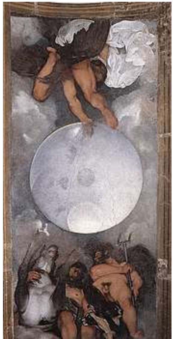
Michelangelo Merisi da Caravaggio: Giove, Nettuno e Plutone (1597)

L’attuale periodo è ideale per sviluppare una maggiore apertura del cuore, considerando che Giove, sulla via verso la congiunzione epocale con Saturno a 0° Aquarius del prossimo Solstizio d’Inverno, si congiungerà tre volte con Plutone in Capricornus (5/4, 30/6, 12/11). Giove governa il chakra del cuore, è il Signore dello Spazio che tutto include, dona e accoglie.