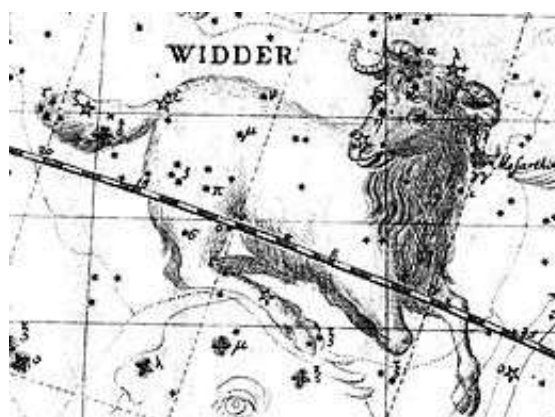
L'Ariete dal vello d'oro, da Uranographia di Johann Bode.

https://www.youtube.com/watch?v=KCTRusGL_oY