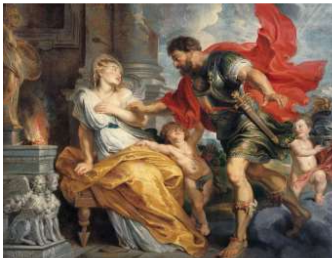
Pieter Paul Rubens: Marte e Rea Silvia, 1620

Marte, governatore exoterico di Aries, congiunto a Giove e a Plutone, avanza verso la congiunzione con Saturno, entrato in Aquarius, rendendosi, con la sua irradiazione di Idealismo e Devozione, anello di congiunzione tra Capricornus e Aquarius. Il Guerriero di luce dona l'Audacia per compiere il passaggio importante dal plesso solare al cuore. A un livello inferiore può però anche esprimersi in un'alimentazione del proprio ego. Il 31 marzo avviene la congiunzione tra Saturno e Marte a 0° di Aquarius, che può esprimersi in modi completamente diversi, a seconda del livello di coscienza: