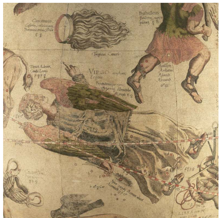
La costellazione della Vergine rappresentata da Gerardo Mercatore

https://www.youtube.com/watch?v=uOjfYQ5rm24