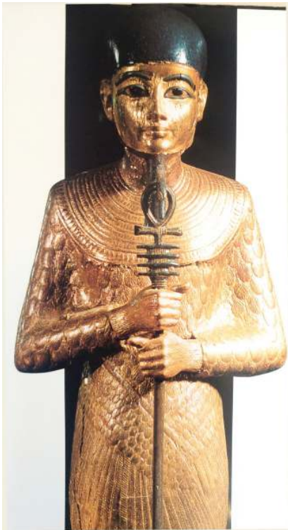
Statua del dio Ptha / Museo del Cairo