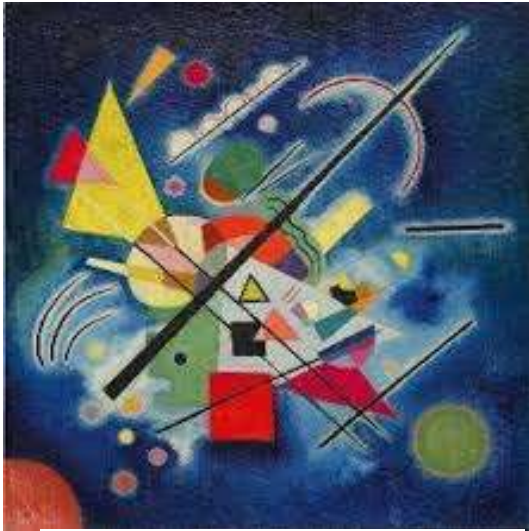
Vasily Kandinsky: Dipintoblu. Guggenheim Museum, New York

Sagittarius introduce alla stagione invernale, a quell'alveo del lavoro interiore che si svolge nel "silenzio".