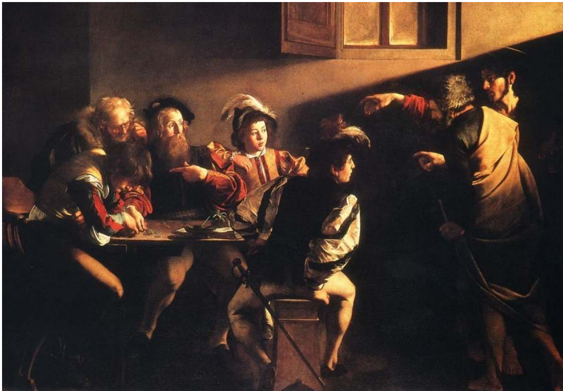
Caravaggio, La Vocazione di San Matteo, 1599-1600

Scorpio è il segno che segue Libra, la 'scelta': qualora questa abbia virato verso il ri-orientamento spirituale, prende avvio un cammino che assicura la giusta direzione sulla via Iniziatica.