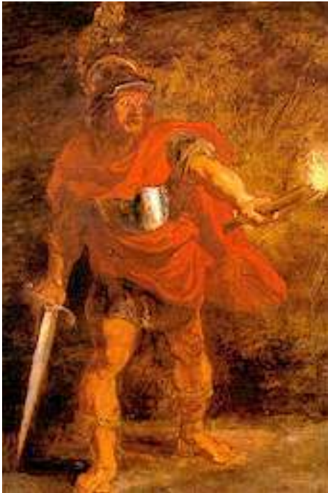
Peter Paul Rubens: La discesa agli inferi di Enea, 1635

Con Scorpio ci addentriamo nei luoghi interiori, più oscuri, laddove giacciono tutte le imperfezioni e le intense pulsioni dei corpi inferiori con le loro brame, ambizioni e orgogli, laddove l'identificazione nella forma prevale e pronuncia: "Fiorisca Maja e l'inganno prevalga".