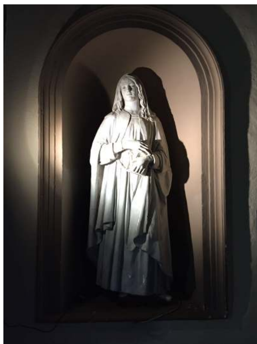
Andrea della Robbia - Vergine

“Virgo è uno dei segni più importanti dello zodiaco, in quanto la sua simbologia concerne lo scopo globale dell’evoluzione, che è di proteggere, nutrire e infine rivelare la realtà spirituale nascosta” 1