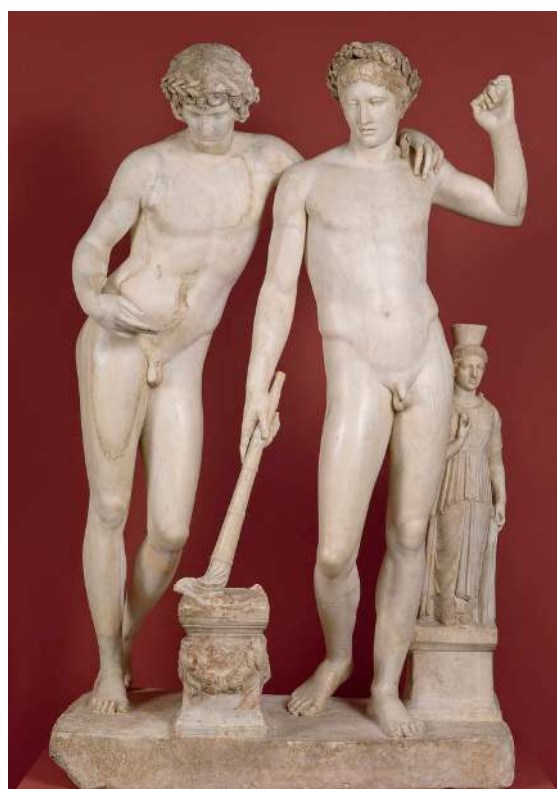
Castore e Polluce, I sec., Museo del Prado (Madrid)

I Dioscuri, i Gemelli celesti Castore e Polluce, simbolo della duplicità del Segno, sono rappresentati in Cielo dalle sette Pleiadi e dalle sette Stelle dell'Orsa Maggiore. La luminosità di Castore, che simboleggia la mortalità, sta progressivamente diminuendo, mentre quella di Polluce, l'immortalità, sta aumentando, a rispecchiare il crescente potere della vita spirituale e la relativa riduzione della forza del sé personale.