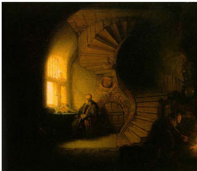
Rembrandt (1606-1669): Filosofo in meditazione

E' l'inizio del ciclo invernale, il momento del raccoglimento interiore, del contatto con la dimensione spirituale. Nel periodo che va dal 21 dicembre al 20 gennaio la velocità della natura è minima, non manifesta, tutto appare immobile, ma la potenza dell'energia del seme, protetto e riscaldato dalla Terra di Capricornus, la sua potenzialità di espressione è massima.