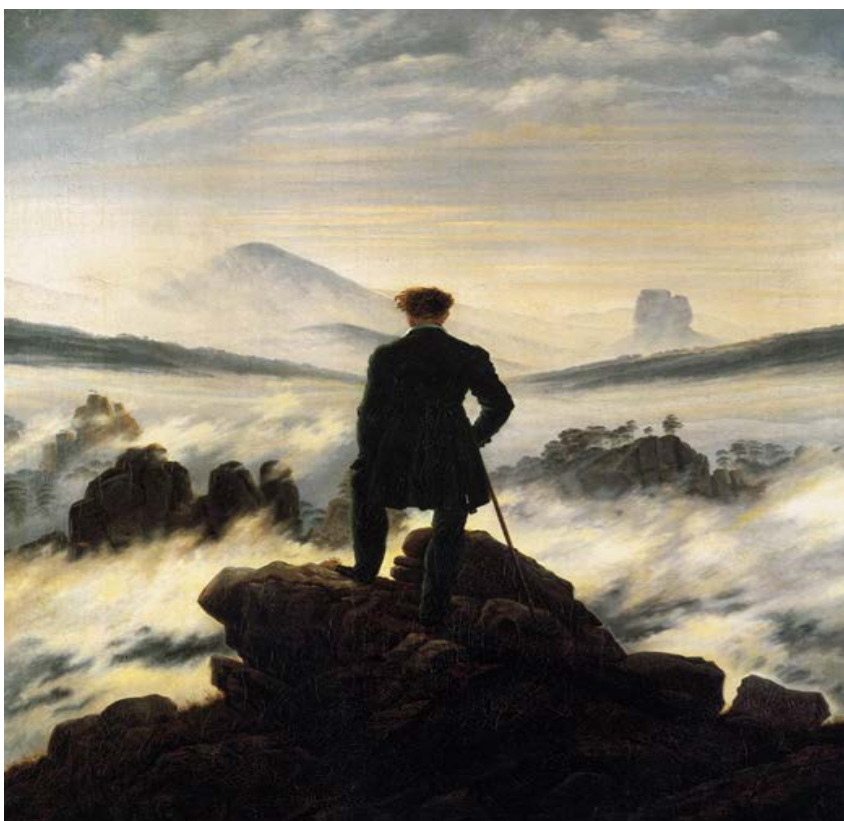
Caspar David Fiedrich (1774-1840): Viandante su un mare di nebbia

Al momento del Plenilunio di Capricornus la Luna, pianeta di IV raggio di Armonia tramite conflitto, nel suo domicilio di Cancer riceve aspetti da quasi tutti gli altri pianeti. E' interessante osservare la disposizione grafica degli stessi all'interno del cerchio zodiacale: la Luna nella parte inferiore e tutti gli altri pianeti, tranne Urano, nella parte superiore. Considerando la parte inferiore del grafico zodiacale lo spazio del lavoro interiore e la parte superiore lo spazio della manifestazione, possiamo affermare che in questo momento tutte le energie planetarie sono in sinergia, in collaborazione e canalizzate a sostegno della Luna, governatore