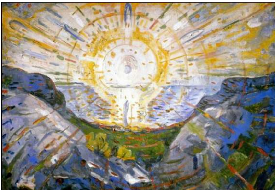
E. Munch, Il Sole (1912)

II Novilunio in Leo: Lunedì 21 Agosto, ore 20.31